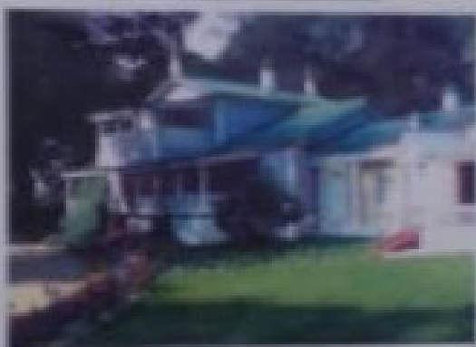
The White House

The White House is the official residence and workplace of the President of the United States. It is located in Washington, D.C. and is one of the most famous buildings in the world. It was built in 1792 and is named for its white exterior.