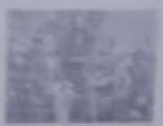
The White House

The White House is the official residence and workplace of the President of the United States. It is located in Washington, D.C. and is one of the most famous buildings in the world. It was built in 1792 and is named for its white exterior.